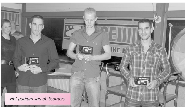
Het podium van de Scooters.