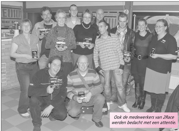
Ook de medewerkers van 2Race werden bedacht met een attentie.