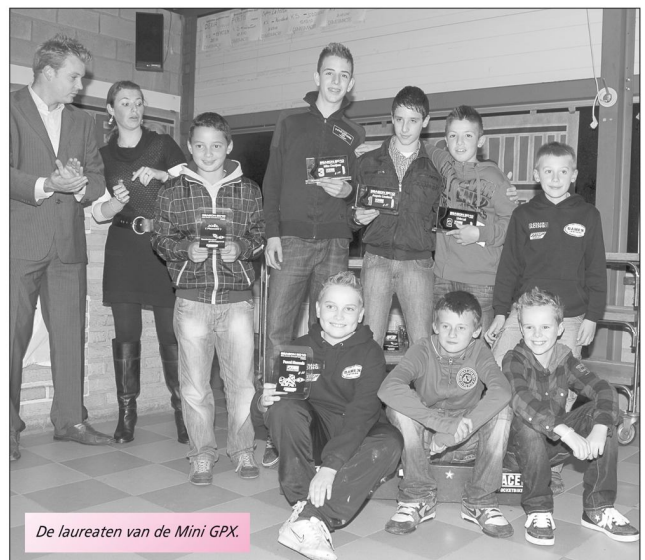
De laureaten van de Mini GPX.